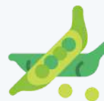
petits pois, fèves