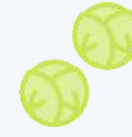
chou de Bruxelles